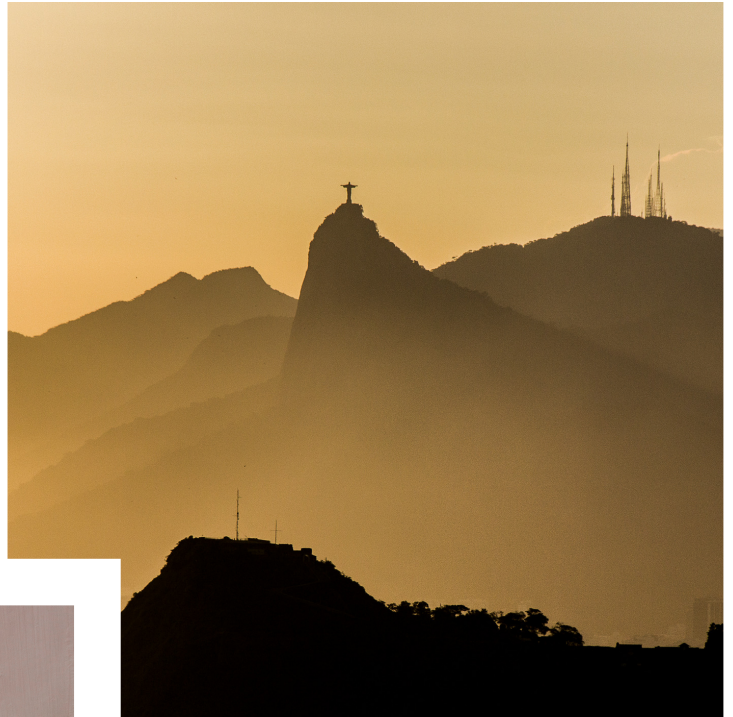
Parque da Cidade

Nas marcações de praias, o destaque vai para Piratininga, Camboinhas e Itacoatiara, com 7 fotos, cada.