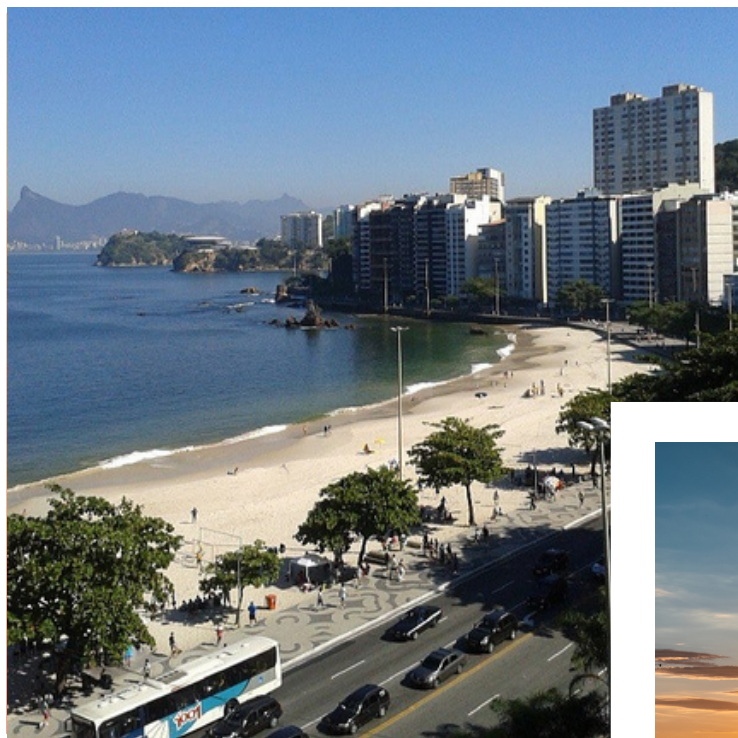
Praia de Icarai

Nas marcações de praias, o destaque vai para Icarai, com 32 marcações