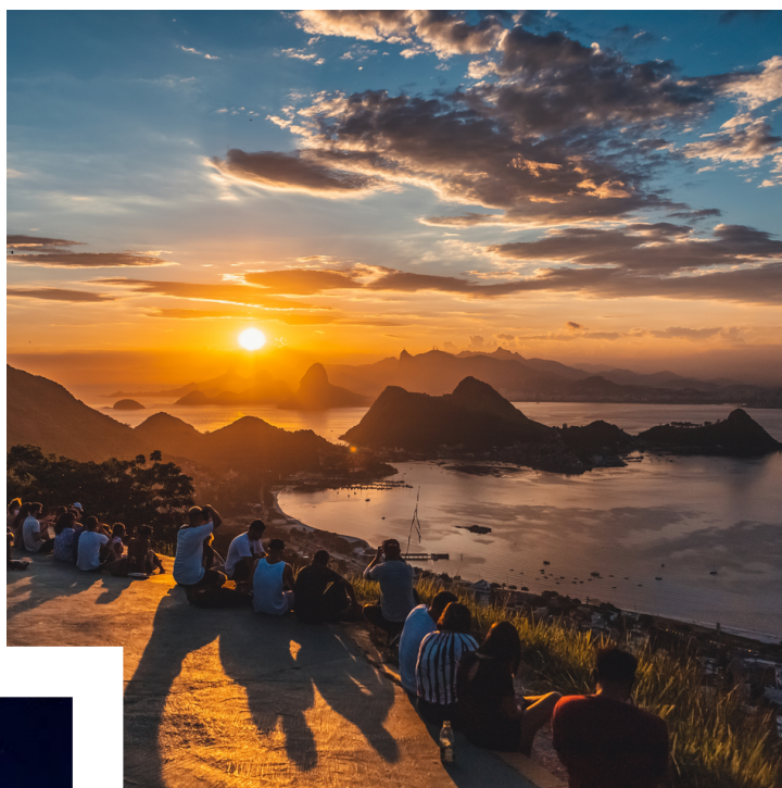
Parque da Cidade

Nas marcações de praias, o destaque vai para Icarai, com 32 marcações